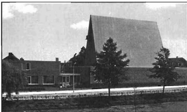
De 'Goede Herderkerk', nu Schenkelkerk, opvolger van 'de Kapel', gezien vanaf de Goudenregenstraat in 1964.