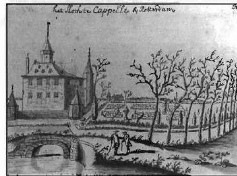
Tekening van 'Het Sloth te Cappelle bij Rotterdam' (anoniem) circa 1737. Tekening: gemeentearchief Rotterdam.

De keuze voor Rotterdam was hem mede ingegeven door de tolerante houding daar ten aanzien van het katholicisme. Openlijke uitoefening van de katholieke eredienst was er weliswaar al sinds 1572 verboden, maar bijeenkomsten in huizen van particulieren werden oogluikend toegestaan en hun geloof was geen beletsel voor katholieken voor deelname aan de stedelijke en bestuurlijke elite van de stad.