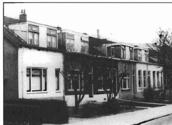
Van Kinsbergenstraat 1, 3 t/m 15. Het adres van de bewoners was eerder Landzicht en alleen bereikbaar vanaf de Nijverheidstraat. Vanaf 1953 werden de woningen opgenomen in de nieuwe Van Kinsbergenstraat, die via de ook nieuwe Doormanstraat kon worden bereikt.