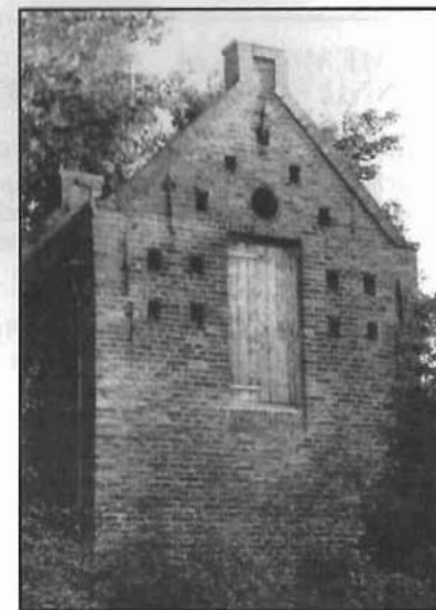
Het Dief- en Duifhuisje aan de noordzijde voordat de vluchtgaten werden dichtgemetseld.

De informatie over duiventillen in Nederland is ontleend aan een artikel "De geschiedenis van de duiventil" door Jenny Roze in "'t Olde Karspel", periodiek van de Historische Vereniging De Wijk - Kockange, juni 2004.