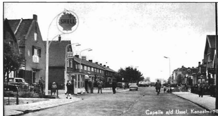
De Kanaalweg rond 1955, gezien in de richting van de 's-Gravenweg. Uiterst links is het pand van Arie Ton, die met als rechterbuur de 'Kapel' een benzinstation exploiteert.

Vanaf oktober 1946 worden in het wijkgebouw op zondagavond kerkdiensten gehouden. Ondanks de slechte staat van het pand, de verouderde inventaris en de ontbrekende kerkelijke sfeer worden de diensten goed bezocht. Plannen worden gemaakt om een aantal dringend noodzakelijke verbeteringen/reparaties uit te voeren en de haveloze ruimten van een nieuwe kwast verf te voorzien. Om het hiervoor benodigde geld te verzamelen wordt een bazar georganiseerd die