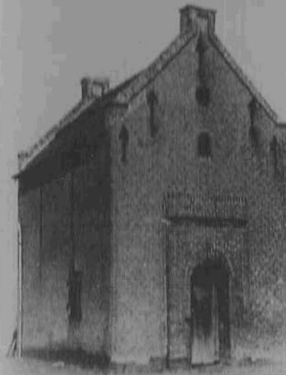
Dief- en duifhuisje!