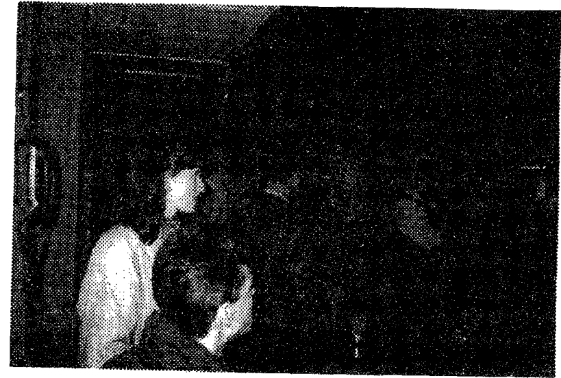
25 oktober 1997 Feestelijke opening van het Historisch Museum

Nationaal Schoolmuseum over "De geschiedenis van de school in Nederland". De vergadering werd goed bezocht.