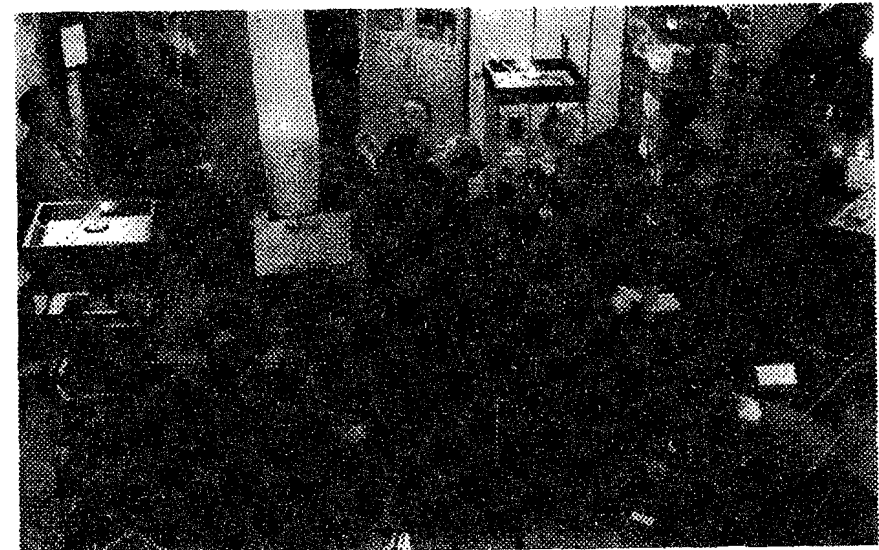
Wethouder D.Kroos-van der Meij tijdens de opening van de expositie Beatrix - 60 jaar - Capelle op 31 januari 1998

Op 31 januari 1998 werd door wethouder mevr. D.Kroos-van der Meijden de tentoonstelling "Beatrix - 60 jaar - Capelle" geopend. Niet alleen op de zaterdagmiddagen ontvingen we veel bezoekers, maar daarnaast kwamen groepen belangstellenden o.a. uit Rotterdam, Krimpen aan den IJssel en Capelle. Deze tentoonstelling loopt tot en met zaterdag 30 april.