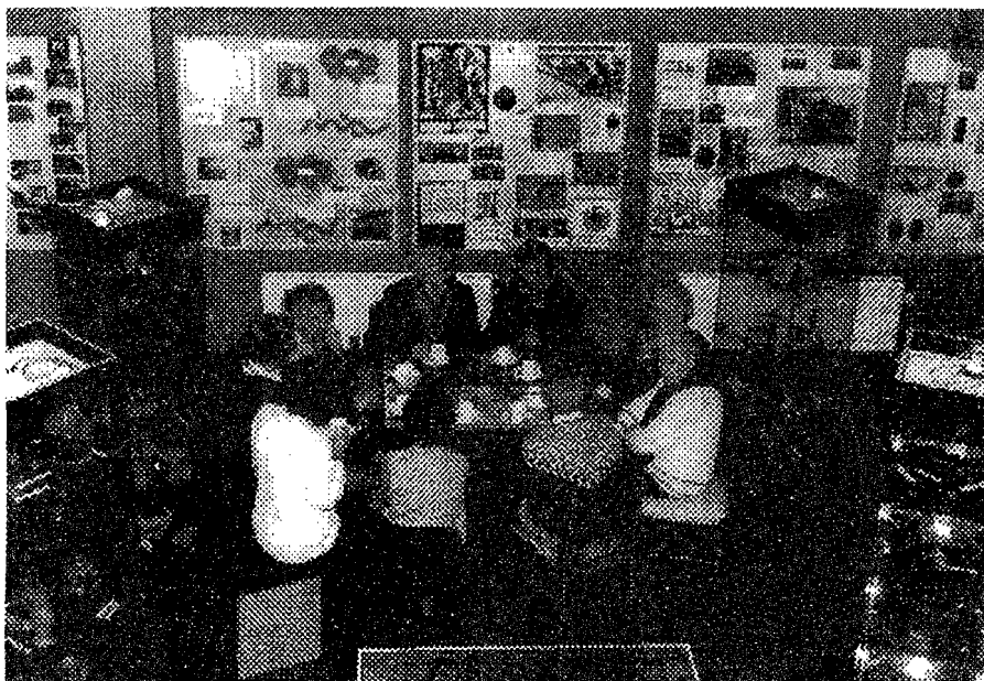
Senioren van "de Wingerd" te Krimpen aan den IJssel op bezoek in het Historisch Museum

In samenwerking met de afdeling Welzijn van de gemeente hebben wij de groepen 7 en 8 van de basisscholen uit Capelle en de deelgemeente Prins Alexander uitgenodigd voor een bezoek aan de tentoonstelling "Het kasteel van Capelle 1275-1525". Er hebben zich inmiddels scholen gemeld, waarvan één groep reeds een bezoek aan het museum heeft gebracht. De groepen worden vakkundig rondgeleid door onze adviseur dr. J.W. Verkaik.