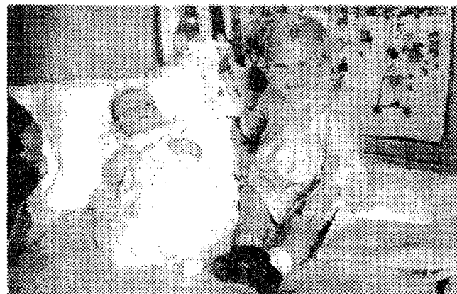
De prinsessen Beatrix en Irene in september 1939

Het is de bedoeling dat de expositie te bezichtigen zal zijn vanaf 31 januari 1998.