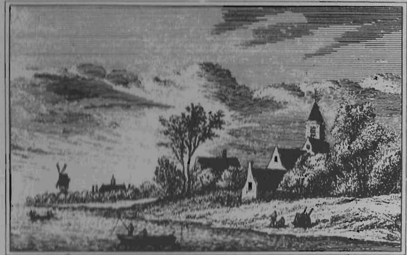
A. Rademaker fecit