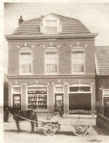
- De IJsselmondselaan -

hun boeken: "De mensen geven ons meestal hun fotoboeken mee. Waar we iets mee kunnen, wordt dan gescand. We hebben inmiddels veel vertrouwen