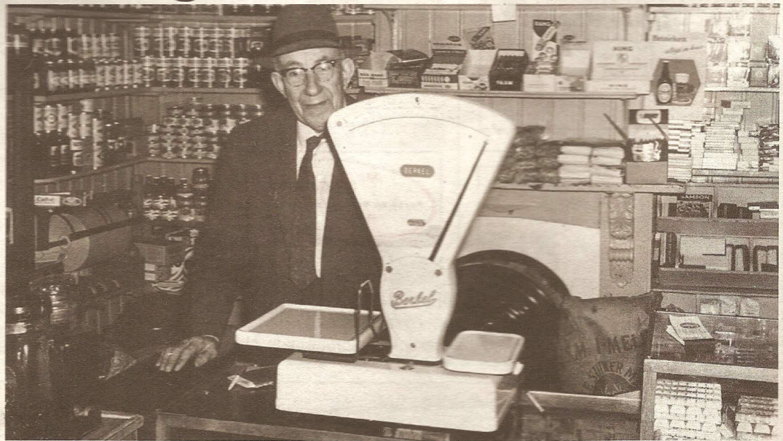
- Het interieur van de winkel in de Nijverheidsstraat -