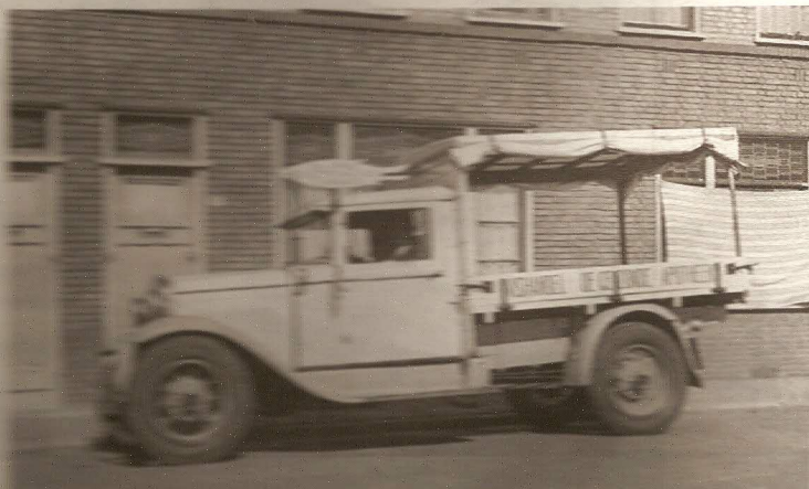
- De Jansma -