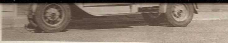
- De Zebrastraat -