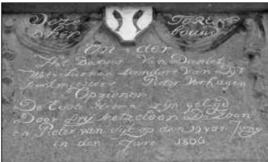
Het schild boven de ingang van de Dorpskerk