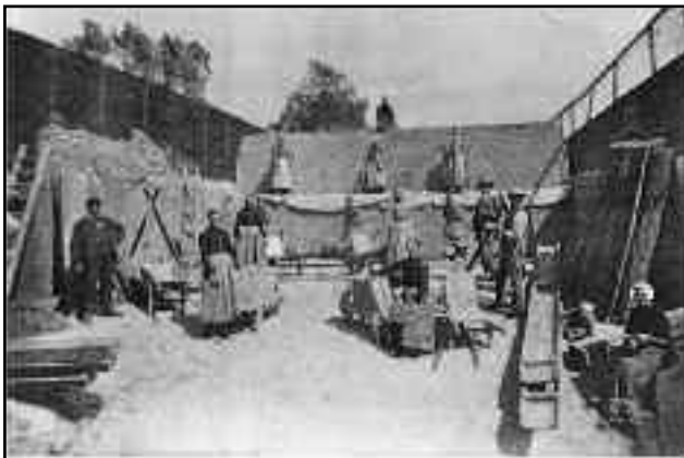
Steenfabriek : volladen van een veldoven voor het bakproces.