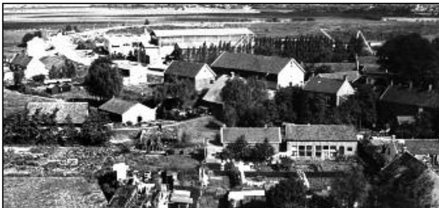
De Tuinstraat en omgeving gezien vanaf de Dorpskerk