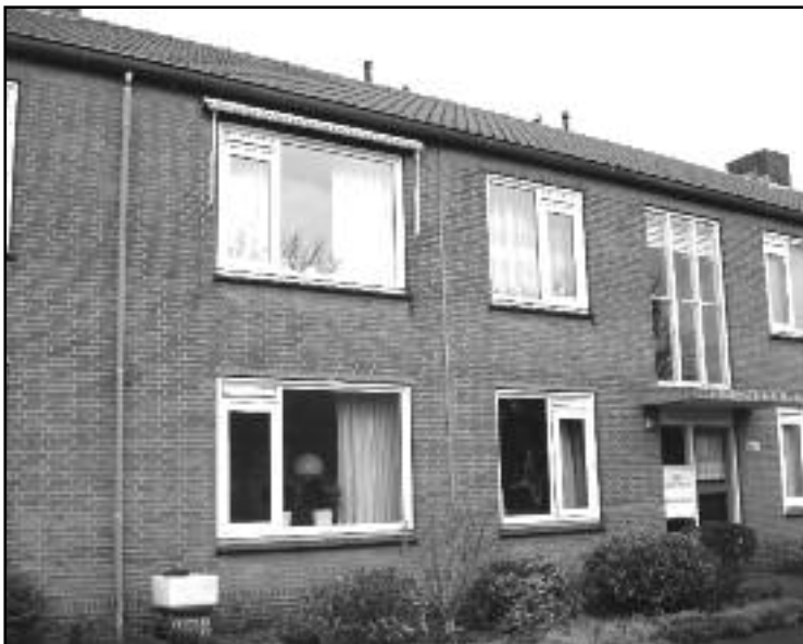
De bovenwoning aan de Violierstraat 84

Dat gaat er dus allemaal op aangewerkt zeg maar. Je hielp gewoon mee met die tuin beneden. Ja, ze hebben er zelf groen ingedaan en daar hebben wij aan mee geholpen. In de andere huizen is dat wisselend. Er zijn verschillende die dat ge-