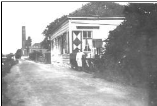
Op de voorgrond de dienstwoning aan de Ringvaart- weg 126 en op de achtergrond het ge- maal aan de Ring- vaartweg 108.

Als kind zwom ik met mijn broertjes en vriendjes in de ringvaart bij die fabriek. Slootje springen was een favoriete bezigheid, en we beseften nog niet hoe belangrijk deze waterlopen zijn voor de polder.