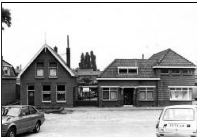
Het gasgebouw aan de Plantsoenstraat 13 in de Oude Plaats