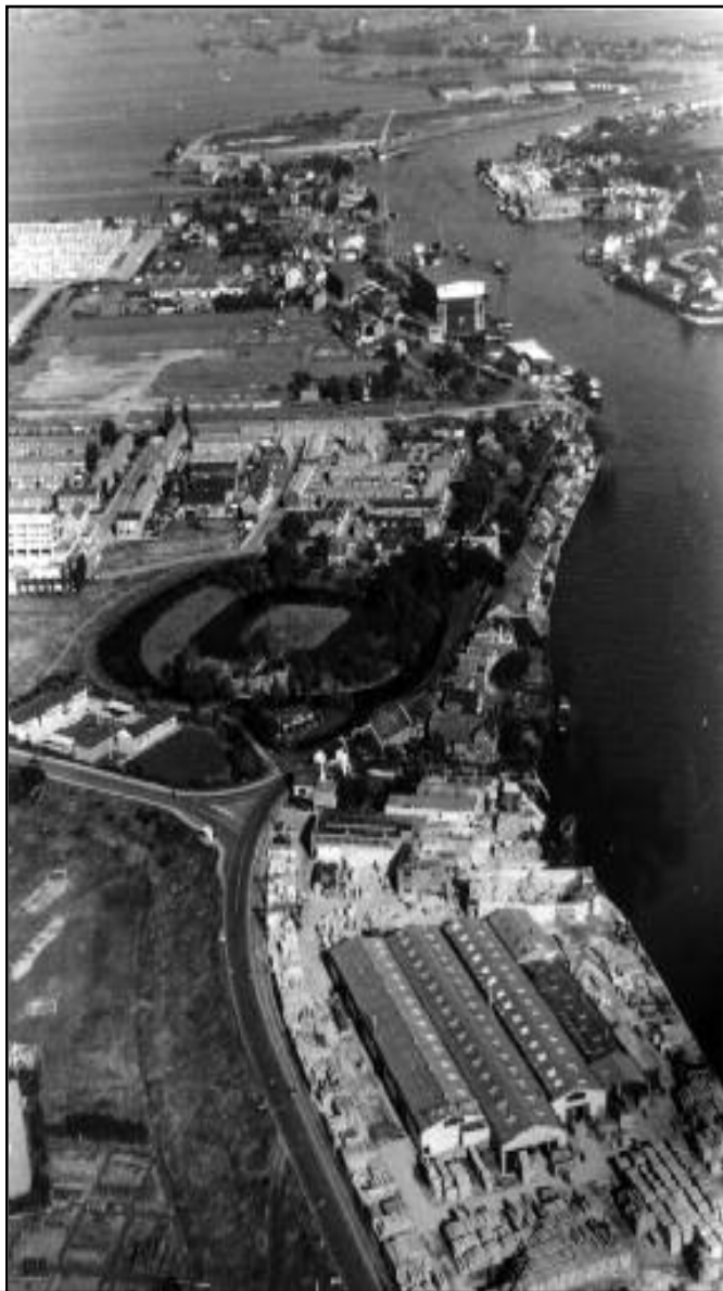
Luchtfoto Hollandse IJssel. Van boven naar beneden langs de Hollandse IJssel ziet men: Ambonnezenenkamp “IJsseloord”, A. Vuijk & Zn Scheepswerven, Slotpark en de fabriek van Feenstra beton. Foto dateert uit 1960. Foto: de Koning.

De basismaterialen werden in een mengmolen gemengd door Wim Koolmees en naar de steenpers gevoerd waar mijn vader de stenen “sloeg”. Ze werden hier op houten panelen gevormd en geperst. Na enige dagen werden de stenen