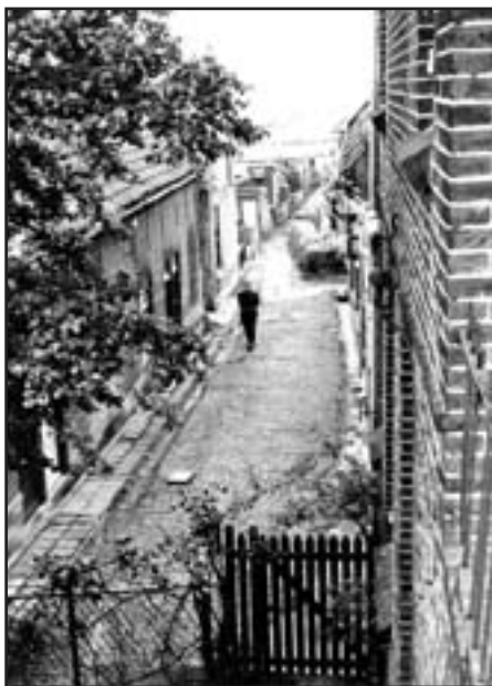
Gezicht op de Tuinstraat vanaf de Dorpsstraat in juni 1967.

We passeren het voormalige koetshuis van de familie Van Walsum, dat door plaatselijke aannemers als