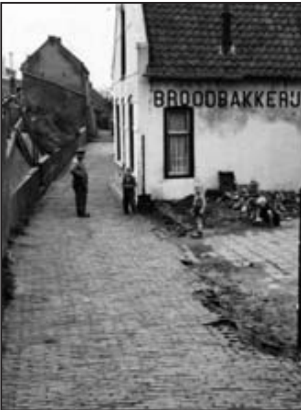
Het straatje beneden langs de Dorpsstraat met de broodbakkerij van Koppenol in oktober 1956.

We keren terug naar de voorkant van de oude schuur van De Wit en gaan via een stenen trap naar een benedendijks gelegen straatje het zgn. ‘Onderlangs’, dat parallel aan de dijk verliep en uitkwam op het eind van de lange stoep. Aan dit ‘Onderlangs’ lag een woonbuurtje