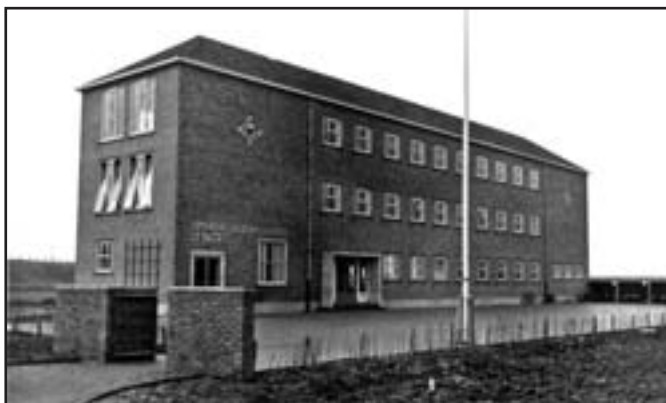
De nieuwe school aan de Rozenburcht.

Mijnheer Cupedo dacht er anders over. Een geweldige verandering. Ik had een directeurskamer, er was een leerkrachtenkamer Mooie, ruime en lichte lokalen. Een grote hal midden in het gebouw. We hoefden voor feesten en ouderavonden nergens meer heen. Hij denkt nog met vreugde terug aan de verhuizing. Het waren fijne jaren in de Slotschool, ook zijn vrouw werkte daar, nu de kinderen volwassen werden. Wel bleven ze wonen in het grote huis aan de Kerkklaan. Dat