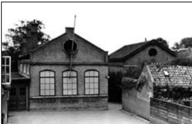
De oude school aan de Dorps- straat

Op de zolder waren er ook twee. Beneden in het zijkamertje was er een en in de keuken ook nog twee, dat zijn er dus twaalf! De slaapplekken beneden veranderden allemaal in kasten, boven verschenen vier slaapkamers en een badkamer en op de zolder ook nog een kamer. De woonkamer was een grote kamer ensuite, met ramen die aan de voorkant uitkeken op de kerk en achter op de tuin. Het waren ramen die je omhoog kon schuiven, en dan een klos eronder om ze open te houden. De keuken keek ook uit op de tuin en op de schuur, die had een vliering waarop de heer Cupedo tot zijn grote vreugde duiven kon houden. In Capelle werden nog een zoon en een dochter geboren.