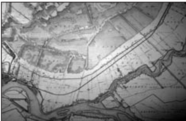
Een kaart van het plassengebied boven Capelle aan den IJssel

Een dergelijke klepstuw is bij opgravingen gevonden in de buurt van de Slotlaan. Dergelijke klepstuwen worden nog steeds gebruikt in de Biesbosch en bij Klein Profijt in de buurt van Rhoon. Doordat deze landbouwgronden (Middelwatering en Oostgaarde) niet afgegraven zijn liggen ze tot op de dag van vandaag hoger dan de wel afgegraven gronden in Schenkel.