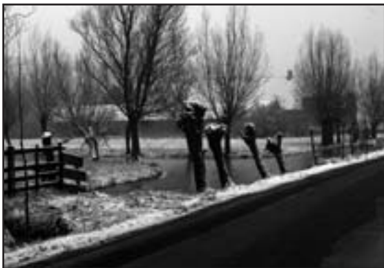
Een winterse opname van de boerderij aan de 's-Gravenweg 394 (nr. 41).