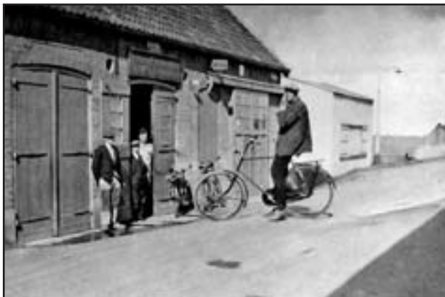
Garagebedrijf Maat aan de Dorpsstraat 203

Naast het Veerhuis voerde een trap naar een pad dat uitkwam op een bloemisterij, waarvan Dalhuizen de laatste eigenaar was. Op Tweede Pinksterdag werden hier onder de naam van 'bloementoonstelling' goede zaken gedaan met de verkoop van vooral planten.