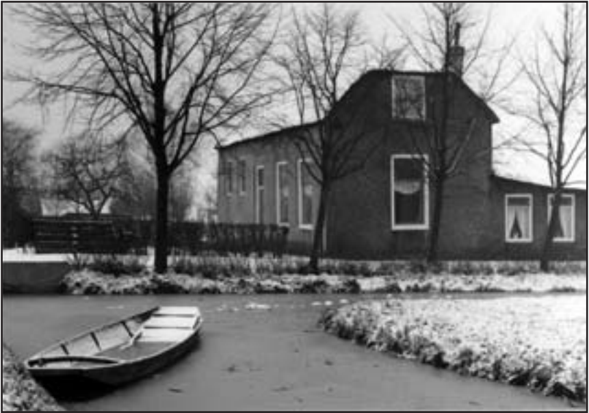
Boerderij aan de 's-Gravenweg 368 (nr. 39).

later wegens verraad de doodstraf tegen zich zou horen eisen.